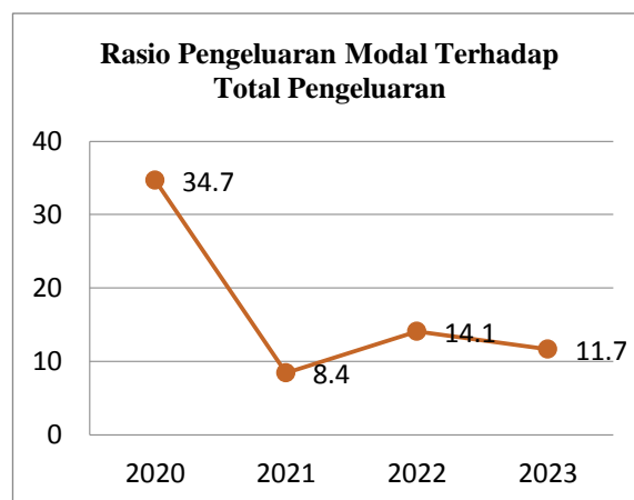
Grafik 3. Ukuran Pengeluaran Modal Tahun 2020-2023

kesimpulan bahwa pada tahun 2020 hingga tahun 2023, rasio pengeluaran modal pada tahun 2020 mewakili 34,7% dari hasil perhitungan. Rasio pengeluaran modal dapat dikategorikan kurang harmonis karena saat ini berada pada angka 20–40% dan akan turun sebesar 0–20% pada tahun 2021–2023, ketika rasio tersebut berada pada jumlah yang tidak proporsional.