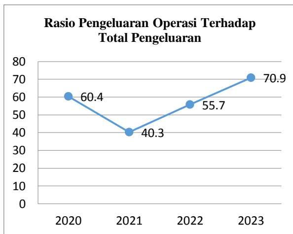
Gambar 2. Grafik Ukuran Pengeluaran Operasi Tahun 2020-2023