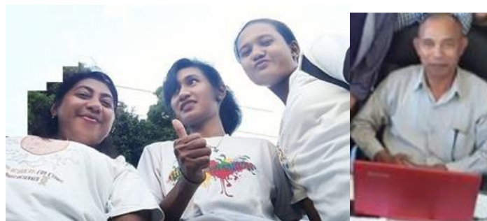
Gambar 4. Tim PKM