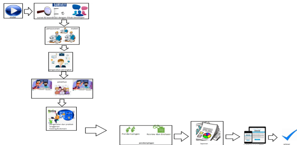
Gambar 1. Prosedur kerja kegiatan PKM

Gambar 1. Menunjukkan prosedur kerja kegiatan PKM ini. Dimana pada gambar ini menerangkan prosedur kegiatan dimulai dengan kegiatan survey dan koordinasi dengan Para Developer Perumahan yang ada di daerah Kota Sorong. Setelah tahap awal yaitu survey, maka tahap kedua yang dilakukan adalah penysunan materi pelatihan yang akan dilakukan. Langkah berikutnya yaitu dilakukannya pengecekan perangkat yang diperlukan serta persiapan pelatihan kemudian pada tahap berikutnya adalah tahap pelaksanaan pelatihan perancangan dan pengelolaan sistem informasi promosi rumah KPR. Setelah kegiatan pelatihan dilakukan terhadap mitra/staff IT dari developer perumahan maka dilanjutkan dengan sharing info langganan serta praktek dari hosting web dan domain. Langkah terakhir adalah pendampingan, review project yang dikerjakan oleh mitra serta evaluasi hasil kerja yang dilakukan.